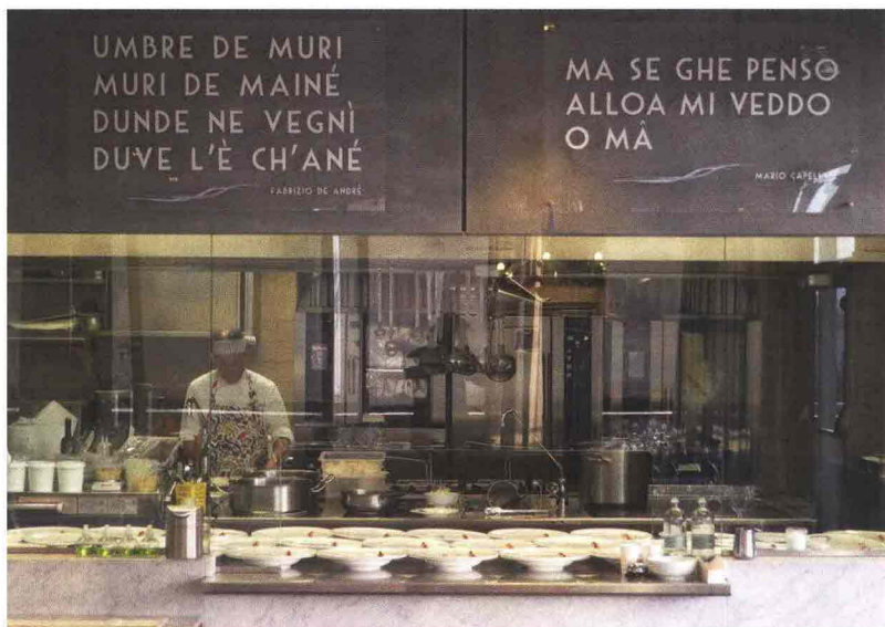
Lo chef Moreno Cedroni in cucina durante l'edizione 2015 di Slow Fish .